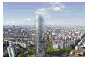
Torre Faro, la nuova sede di A2A a Milano