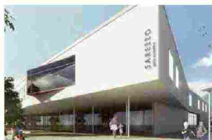
Progetto in BIM per il polo scolastico di Sarezzo