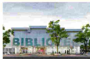
Una nuova biblioteca nel Palazzo del Turismo di Bellaria