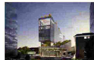
Ricerca medica ed efficienza energetica per Vitae a Milano